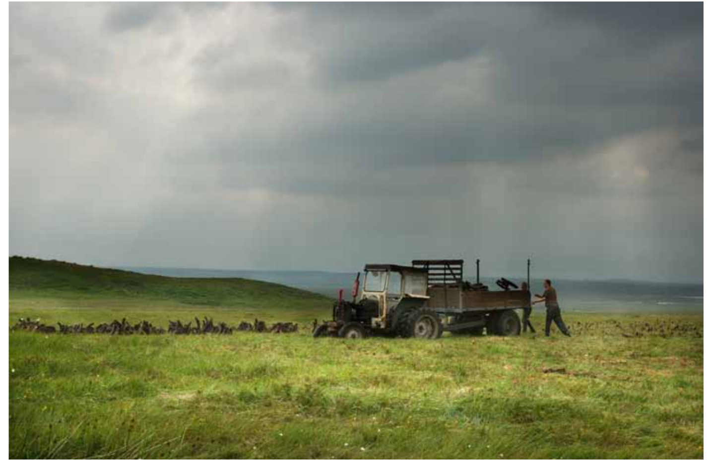
Uit de serie 'Turf'.