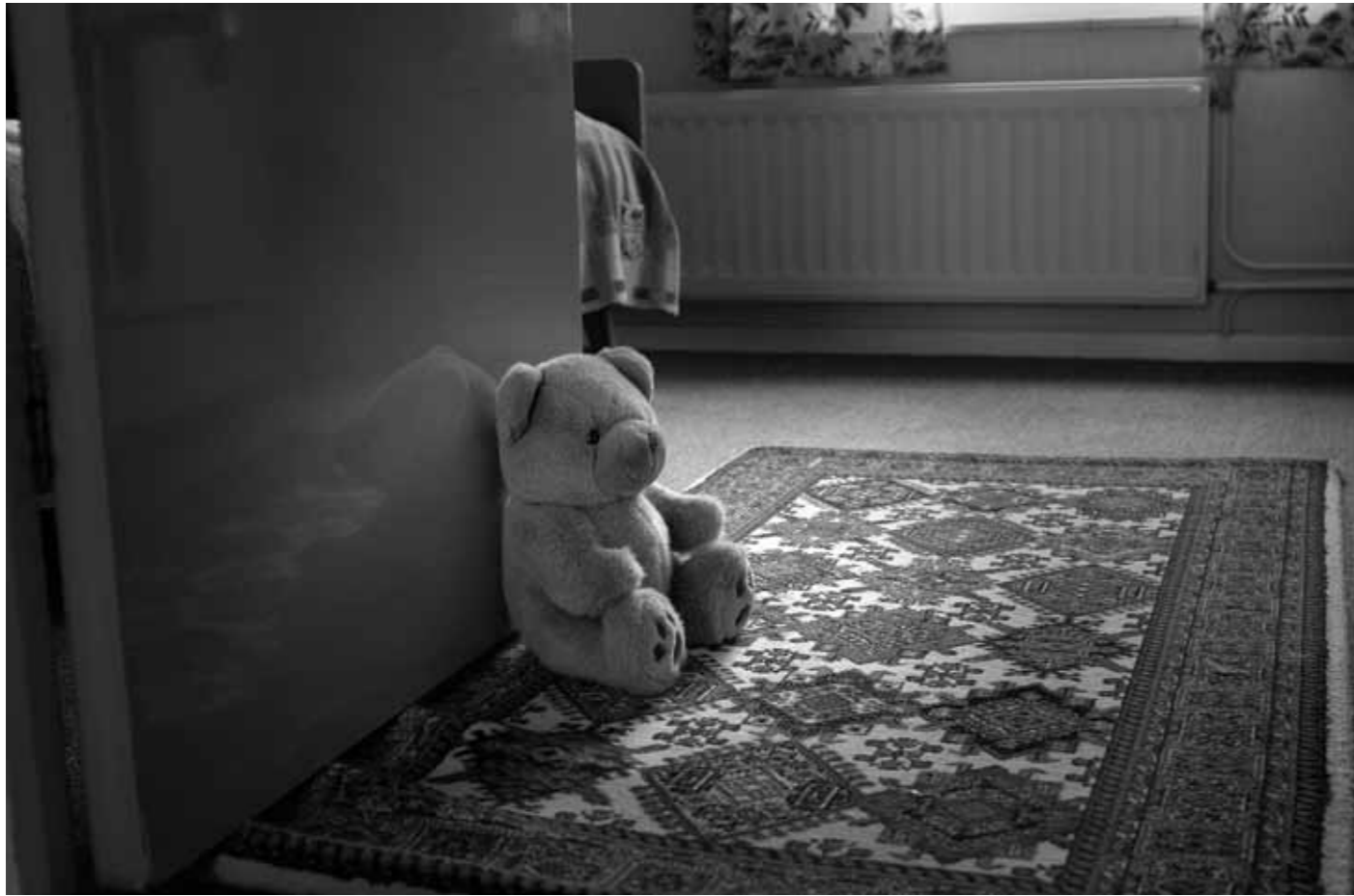
Uit de serie 'Gerko, een man alleen'.